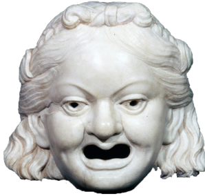
Bouche en marbre d'une fontaine ; Pompéi ; 1 er siècle ap. J.-C. ; marbre ; 18 x 21 cm

La vie à Pompéi était prospère. La journée, les rues étaient animées, les habitants se rendaient au marché pour acheter leurs biens de consommation et toutes sortes d'objets issus des nombreux échanges commerciaux encouragés par la ville et toute la région du Vésuve. Les fouilles archéologiques ont montré que les habitants de Pompéi, et notamment les classes les plus riches, aimaient posséder et orner leurs maisons de nombreux éléments décoratifs, comme des statues, des fontaines, de merveilleuses mosaïques et fresques, pour l'intérieur et l'extérieur. Les objets d'usage quotidien retrouvés sont particulièrement intéressants ; parmi les plus saisissants se trouvent de très précieux bijoux ou des ustensiles de cuisine qui laissent entrevoir les habitudes de la population au 1 er siècle après J.-C.