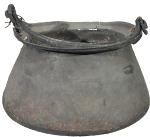
Cocotte avec une poignée ; Pompéi ; 1 er siècle ap. J.-C. ; bronze ; 15 x 20 cm

"Longtemps les dons de la générosité de la Terre demeurèrent cachés, et l'on regardait les arbres et les forêts comme le plus beau présent fait à l'homme. Ce sont les arbres qui fournirent les premiers aliments, dont le feuillage rendit la caverne plus moelleuse, dont l'écorce servit de vêtement : encore aujourd'hui des nations vivent ainsi. C'est à s'étonner de plus en plus que de tels commencements l'homme en soit venu à percer les montagnes pour en arracher le marbre, à demander des étoffes au pays des Sères, à chercher la perle dans les profondeurs de la mer rouge, et l'émeraude dans les entrailles de la terre." Pline l'Ancien, Naturalis Historia , XII 1-2