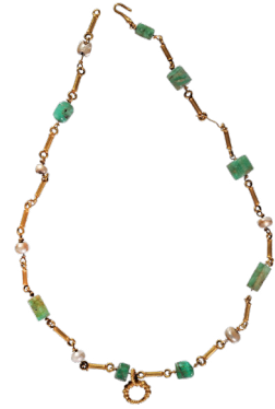
Collier en or, émeraudes et perles ; Pompéi ; I er siècle ap. J.-C. ; or, gemmes : 38,8 cm

Pompéi est née au IV ème siècle avant J.-C. de l'union de cinq villages Osques fondés au siècle précédent. Dans la deuxième moitié du I er siècle après J.-C., qui verra les dernières années de son existence, la densité de population était à son sommet, avec environ 20 000 habitants. À l'époque, la ville basait son économie sur le commerce de fruits, légumes, céréales, vin, huile, qu'elle exportait à Rome.