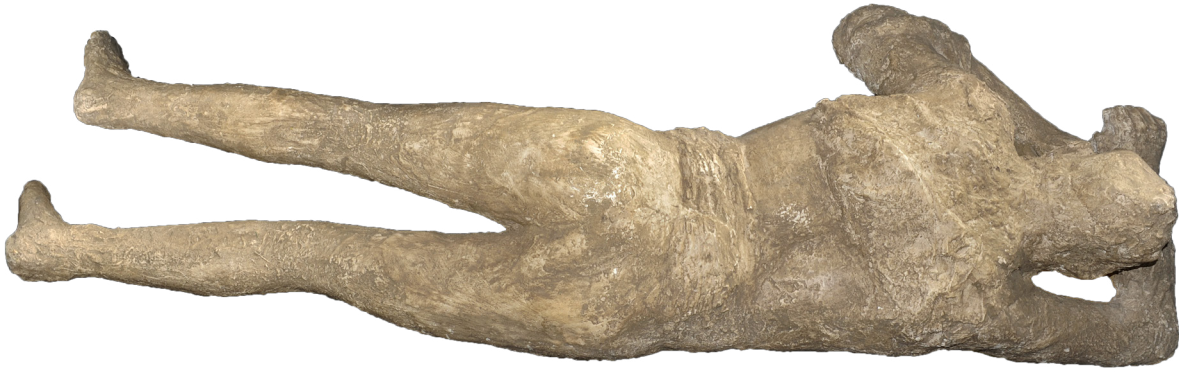
Moule d'une victime de Pompéi (femme) ; Pompéi ; I er siècle ap. J.-C. ; plâtre ; 45 x 170 x 66 cm

Le visiteur a ainsi la possibilité non seulement de comprendre le processus qui a rendu possible l'existence de tels témoignages, mais également d'expérimenter la proximité et le fort impact émotionnel que les moulages continuent à susciter en ceux qui les observent.