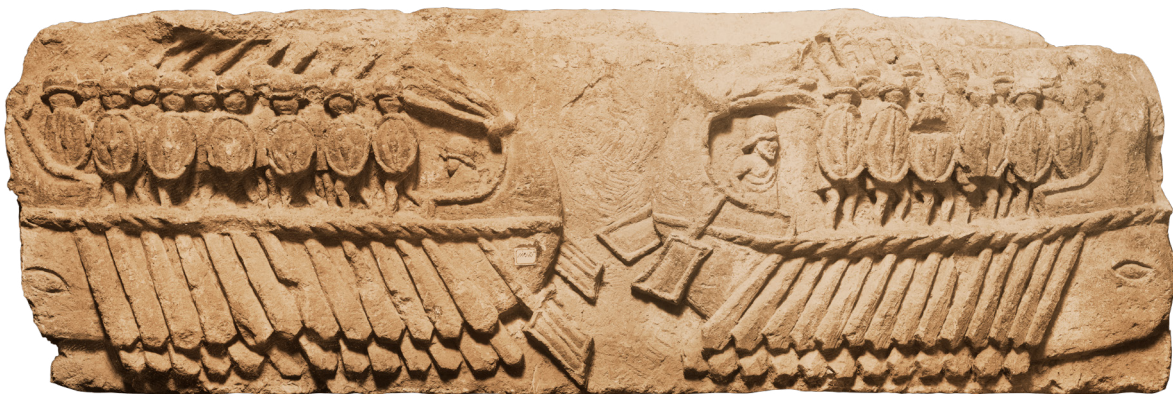
Relief représentant deux navires de guerre romains avec des soldats ; II ème -I er siècle av. J.-C. ; calcaire ; 50 x 144 x 27 cm

En nommant Pline l'Ancien à ce poste stratégique, Vespasien manifestait la confiance qu'il avait en cet homme. La force militaire basée à Misène était en effet la plus importante d'Italie car les légions étaient positionnées aux confins de l'Empire dans les zones frontalières. Lors de la guerre civile de 69 après J.-C., la flotte de Misène se range aux côtés de Vespasien et l'aide à obtenir le pouvoir. L'Histoire nous apprend que Pline avait fait son service militaire avec Titus, fils de Vespasien, bien avant que ce dernier ne devienne empereur. C'est probablement grâce au soutien de Titus que Pline est promu après une importante carrière administrative menée dans différentes provinces de l'Empire. L' "Histoire naturelle" est d'ailleurs dédiée à Titus qui devient empereur en 79.