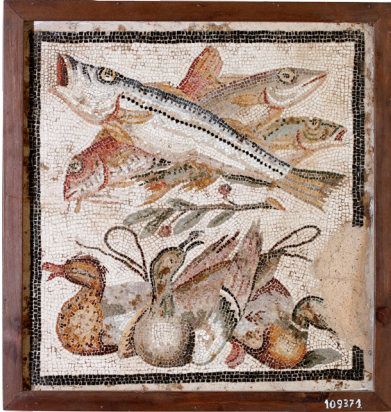
Mosaïque avec nature morte de poissons et autres animaux ; Pompéi ; 1 er siècle av. J.-C. ; mosaïque, calcaire ; 14,2 x 84,7 x 5 cm

Cette sous-section invite le visiteur à se rendre compte du développement, de la densité et de la complexité du réseau de trafic commercial, maritime et fluvial à l'époque romaine. L'analyse de ce réseau laisse percevoir la subtile interaction entre routes commerciales, technologies de navigation, circulation de personnes, échanges marchands et culturels. L'exposition explique par ailleurs les dynamiques, dans une échelle bien inférieure à celle d'aujourd'hui, d'une "mondialisation" antique, phénomène considéré à tort comme exclusivement contemporain.