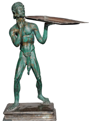
Statuette représentant un marchand de pain ; Pompéi, Maison d'Ephèbe ; I er siècle ap. J.-C. ; bronze ; 26 x 12 x 8,5 cm