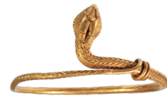
Bracelet ; Pompéi ; I er siècle ap. J.-C. ; or ; 6,3 x 6,3 cm